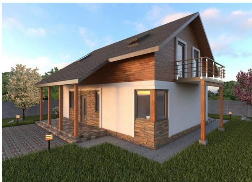
Рисунок 8. Канадський будинок від «Екопану»

Вартість будинку — близько 500\text{ \$/м}^2 з урахуванням внутрішньої обробки.