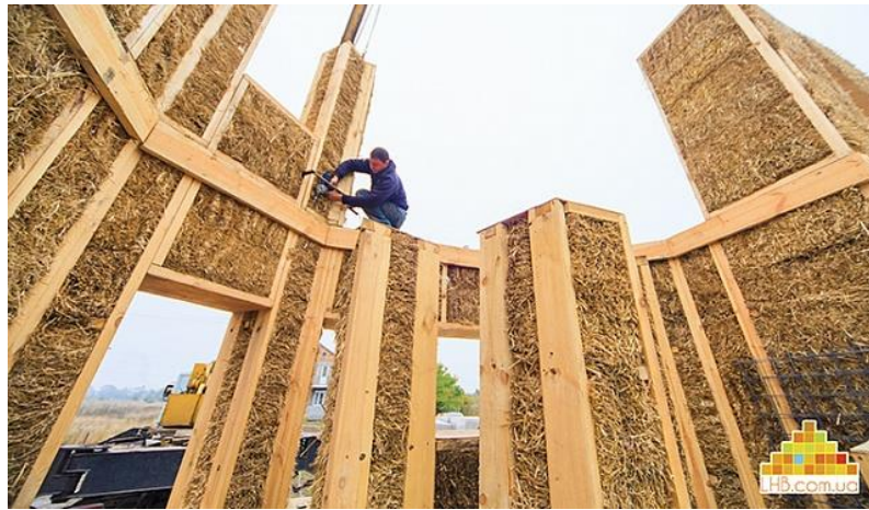
Рисунок 7. Каркас будинку LifeHouseBuilding