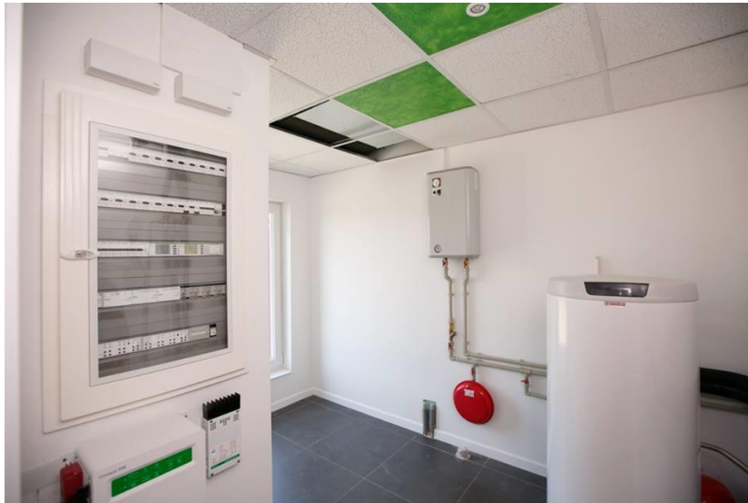
Рисунок 5. Опалення будинку

приміщення навіть при закритому вікні. А фільтр надійно захищає від попадання пилу і комах.