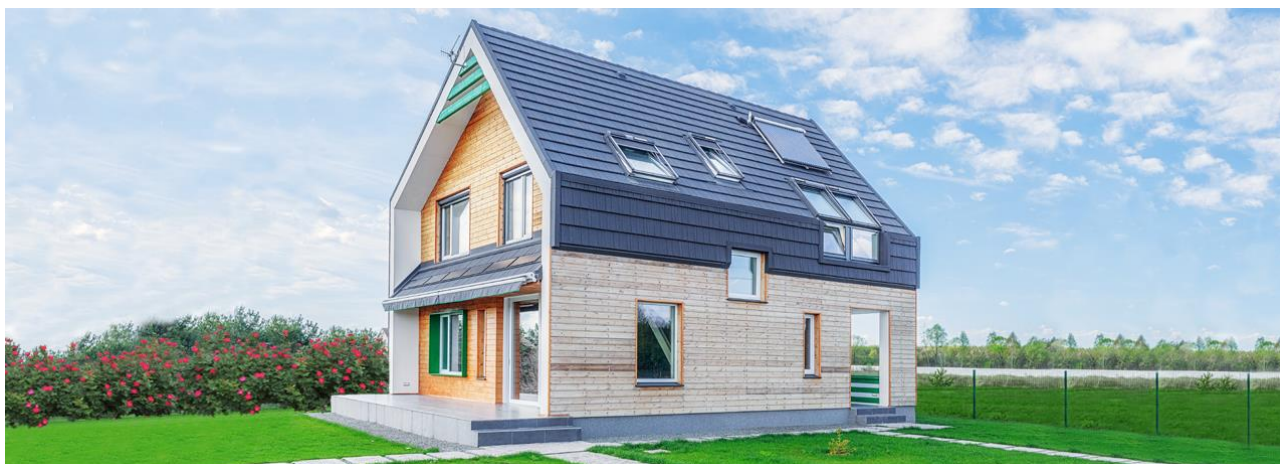
Рисунок 4. Енергоефективний будинок, с. Микуличі, Київська область

Компанія «ВЕЛЮКС» Україна є одним із організаторів першого проекту енергоефективного будинку, створеного на основі концепції Активний дім. Енергоефективний будинок побудували в селі Микуличі (20 км від Києва) на ділянці 0,06 га, що розташована на території котеджного містечка. OptimaHouse - це сучасний будинок загальною площею 128 кв.м з мансардним поверхом та терасою, розрахований на проживання сім'ї з 3-х чоловік. На двох поверхах, включаючи мансарду, розміщені вітальня, кухня-їдальня, 2 спальні, загальна гардеробна, с/в з душовою, простора ванна з пральною, технічне приміщення з усіма інженерними системами. В OptimaHouse встановлено 9 мансардних вікон лінії Premium. Переважна частина вікон з дистанційним керуванням та живленням від сонячної батареї для більшого ефекту енергозбереження. Всі вікна оснащені загартованим зовнішнім склом і внутрішнім склом «триплекс» для безпеки та комфорту мешканців будинку. Обов'язковим елементом конструкції є клапан для провітрювання зі змінним фільтром. У відкритому вигляді він сприяє проникненню свіжого повітря в