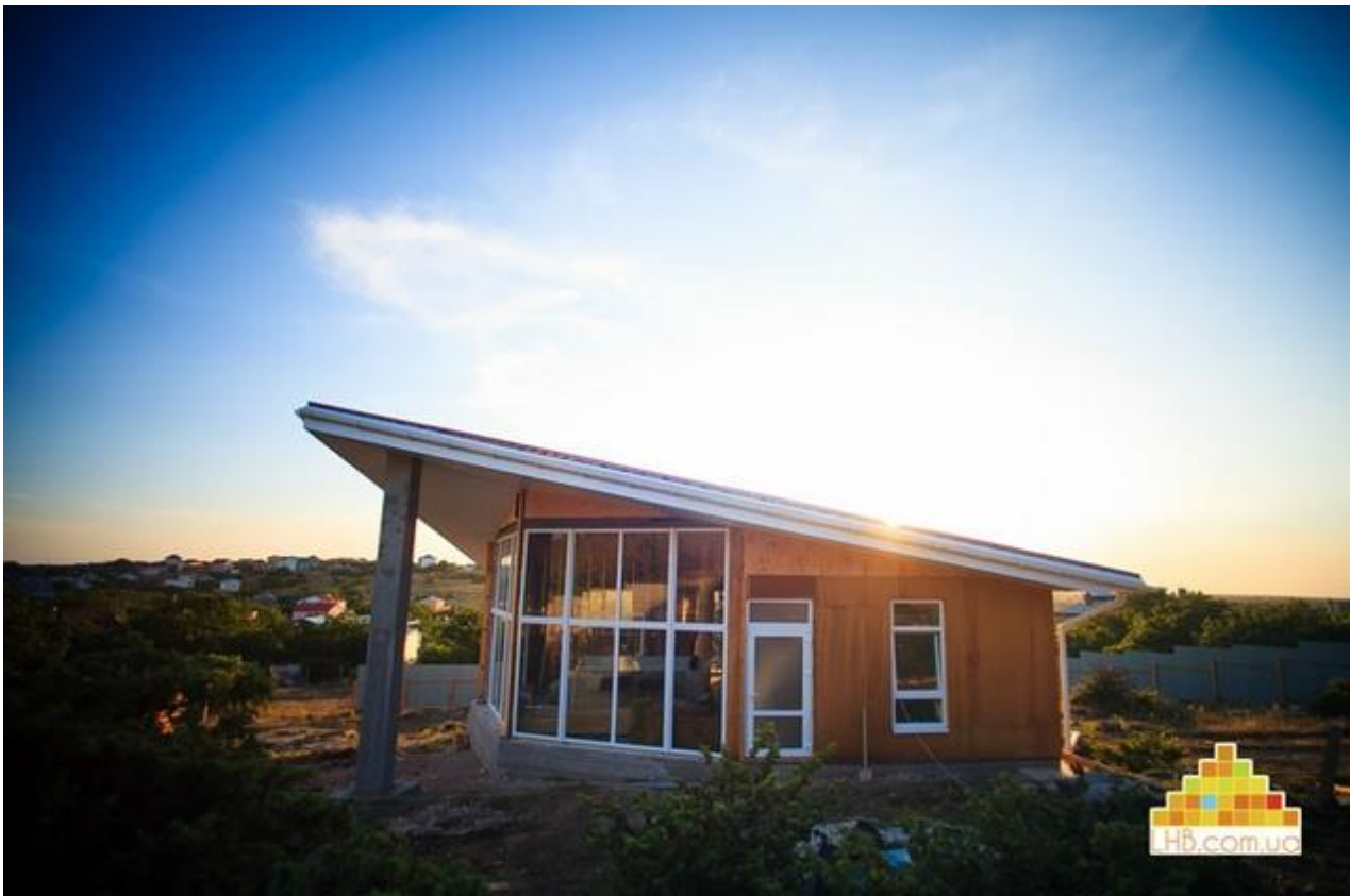
Рисунок 6. Будинок LifeHouseBuilding

У Дніпрі придумали спосіб швидкого будівництва екобудинків — за допомогою панелей із соломи. Солома — доступний природний матеріал. Процес дуже простий: на дерев'яний каркас пресом утрамбовується солома. Краї підрівнюють і отримують рівну панель. У такий спосіб можна «побудувати» солом'яний будинок всього за 2 місяці. Переваги солом'яного матеріалу — це його теплохарактеристики, які в 2 рази більше необхідних.