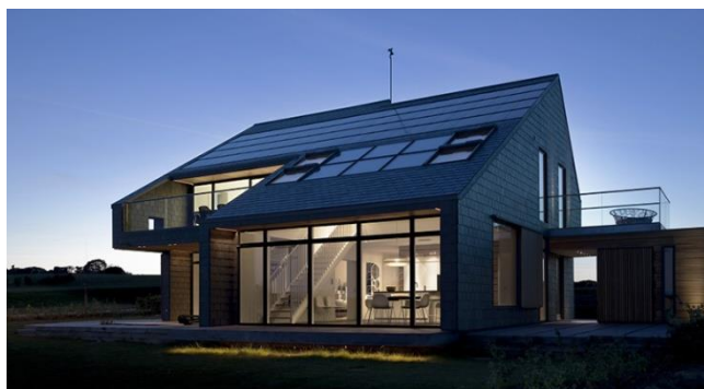
Рисунок 3. Місто Люstrup (Данія). Проект під назвою «Active House», 2009 рік

Саме в Данії був вперше побудований будинок, що виробляє енергію. Подальші розробки ведуться як в області вдосконалення технологій споруди екобудинків, так і в області проектування цілих міст, що забезпечують себе енергією у відсутності окремих енергостанцій. Такі міста заздалегідь отримали назву «стабільних» - за задумом, вони не тільки економлять енергію, але й взагалі не мають негативного впливу на навколишнє середовище.