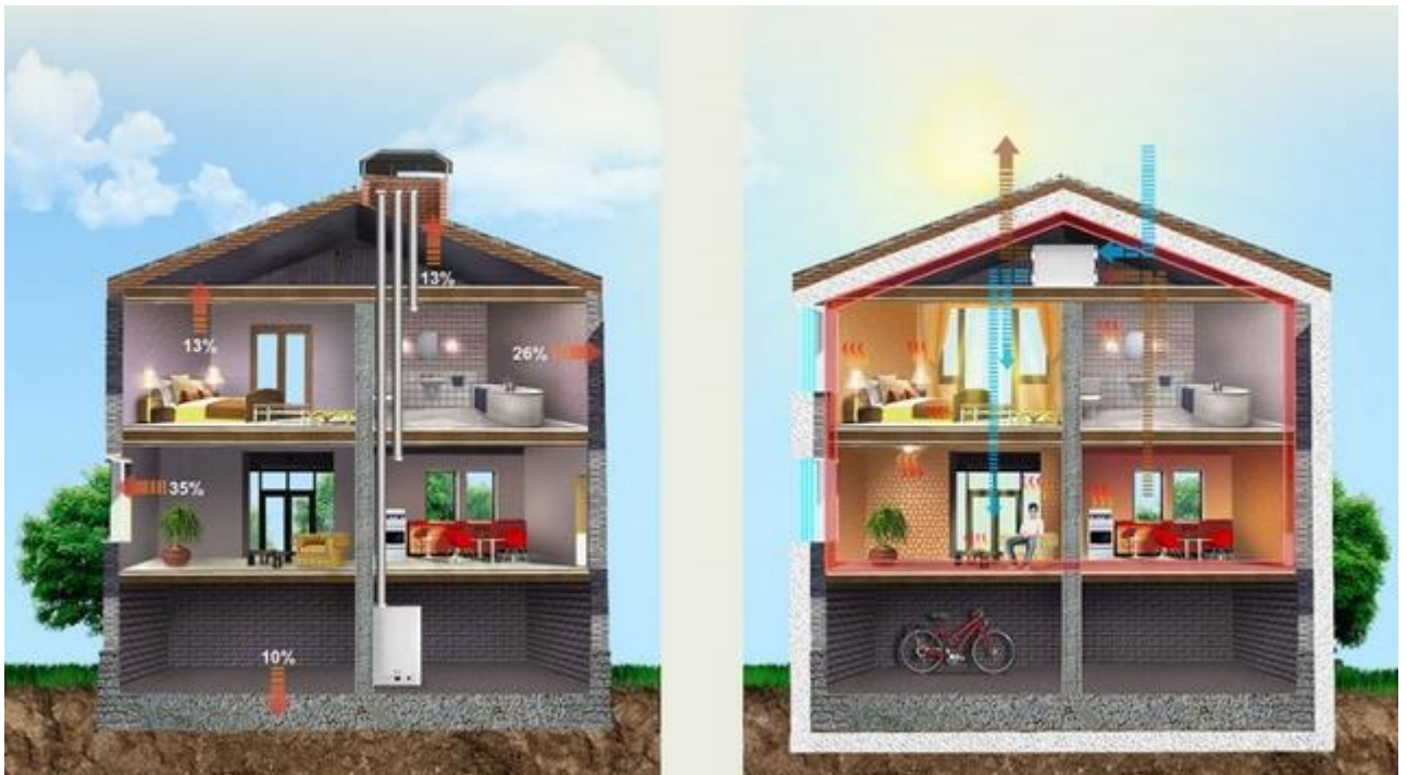
Рисунок 10. Будинок в розрізі за принципом Passivhaus

Вартість будинку — 1000 $/м 2 з урахуванням внутрішньої обробки, комунікаціями і сантехніки.