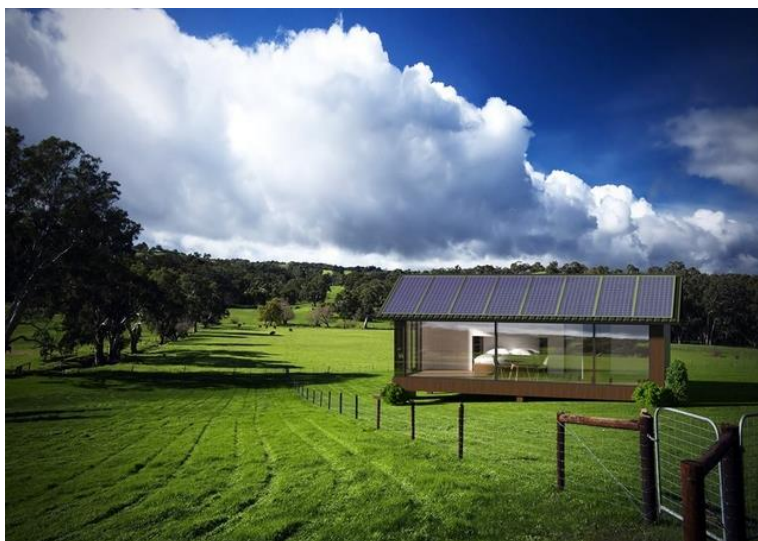
Рисунок 9. PassivDom

PassivDom — це «розумне» житло: система сама регулює температуру в приміщенні за даними прогнозу погоди, контролює заряд акумуляторів та багато іншого. За допомогою програми на смартфоні функціями будинку можна управляти.