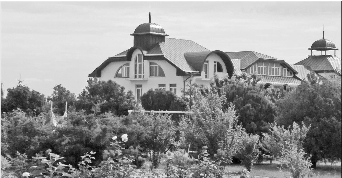
Міжнародний реабілітаційно-рекреаційний центр готовий на вісімдесят п'ять відсотків

Отже, природні цілющі багатства Херсонського краю оздоровлюють, лікують, повертають життєві сили. А ще — приваблюють туристів та інвесторів, поповнюють місцеві бюджети. Виходить, перспективи розвитку оздоровчого й медичного туризму на Херсонщині безмежні. Слід лише розумно скористатися тим безцінним надбанням, що подарувала природа цьому краю.