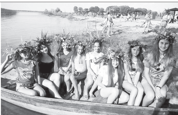
Різноманітні заходи розширили світогляд дітей і залишили яскраві враження