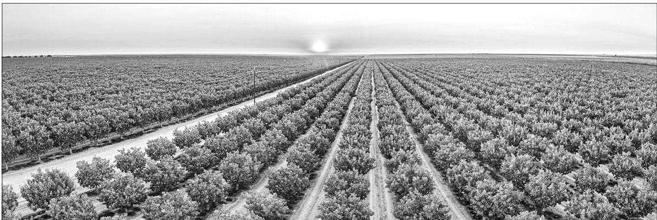
Зі зміною клімату за деякий час український південь тішитиме ось такими фісташковими краєвидами

Отже, знайти свою нішу, унікальність, перейти на вирощування екзотичних для України культур — саме ті перспективи, над якими вже має замислитися дбайливий господар. А вчені можуть надати наукову підтримку й поділитися власними розробками з аграріями, які готові ризикувати і заробляти.