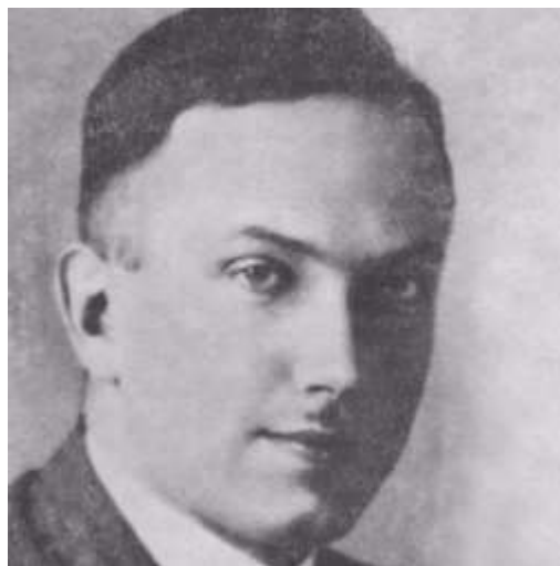
ЮРІЙ ЛИПА (1900-1944) «Призначення України» (1938) «Чорноморська доктрина» (1940) «Розподіл Росії» (1941)