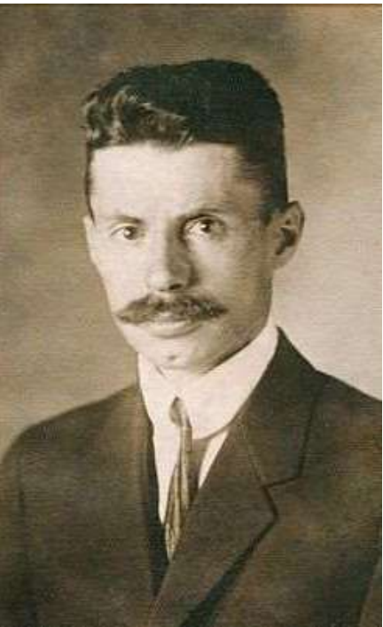
В'ЯЧЕСЛАВ ЛИПИНСЬКИЙ (1882-1931)

«Україна на переломі. 1657-1659» (1920) «Релігія і церква в історії України» (1925) «Листи до братів-хліборобів» (1926)