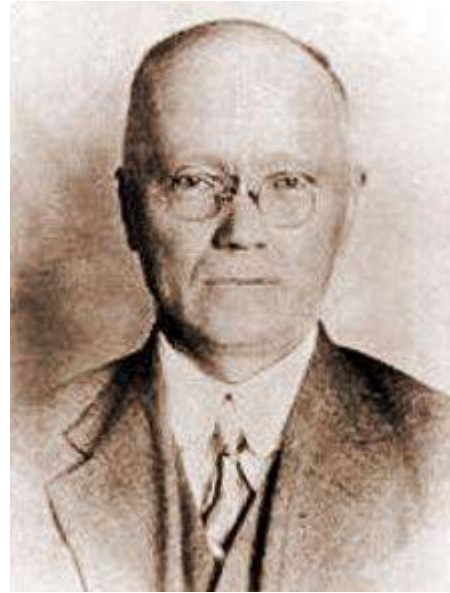
СТЕПАН ТОМАШІВСЬКИЙ (1875-1930) «Галичина» (1915) «Під колесами історії» (1922)