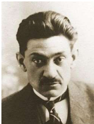
ДМИТРО ДОНЦОВ (1883-1973)

Теоретик інтегрального (чинного) націоналізму «Націоналізм» (1926)