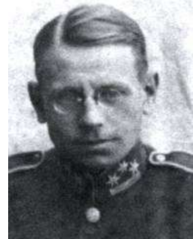
МИКОЛА СЦІБОРСЬКИЙ (1898-1941) «Націократія» (1935)