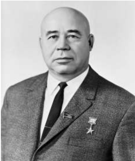
ПЕТРО ШЕЛЕСТ (1908-1996)

Перший секретар ЦК КПУ (1963-1972) «Україно наша Радянська» (1970)