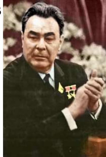
ЛЕОНІД БРЕЖНЄВ (1906-1982) Генеральний секретар ЦК КПРС (1964-1982) «Ленінським курсом: промови і статті» (1970- 1982)