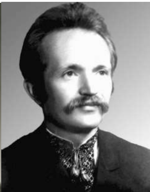
В'ЯЧЕСЛАВ ЧОРНОВІЛ (1937-1999) «Саміздат» «Лихо з розуму» (1967)