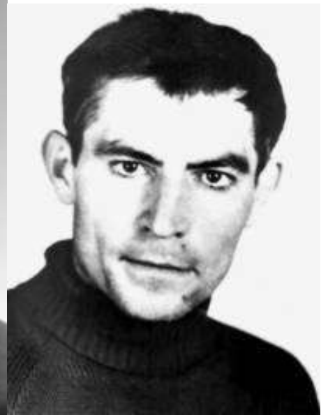
ВАСИЛЬ СТУС (1938-1985) «З таборового зошита» (1982) «Лист до Президії Верховної Ради СРСР» (1976) «Я обвинувачую» (1975)