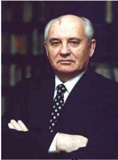
МИХАЙЛО ГОРБАЧОВ (1931-2022)

Президент ССРСР «Перестройка и новое мышление для нашей страны и для всего мира» Ідеї економічних, політичних ре- форм, відмова від протистояння з Заходом