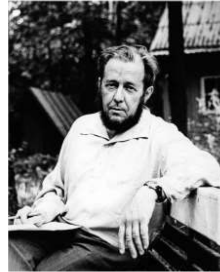
ОЛЕКСАНДР СОЛЖЕНИЦІН (1918-2008)