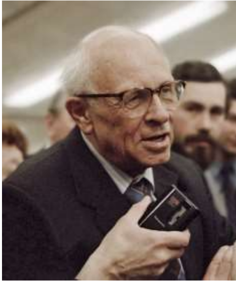
АНДРІЙ САХАРОВ (1921-1989)

Фізик, розробник атомної та водородної бомб