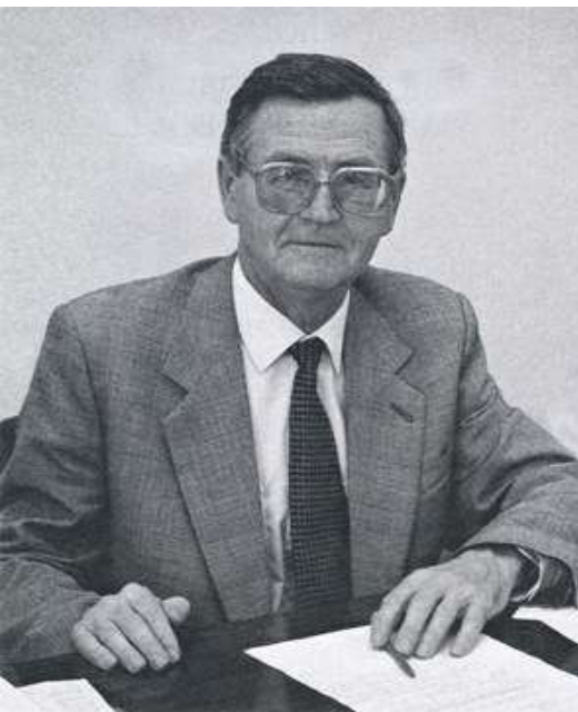
ІВАН ДЗЮБА (1931-2022) «Інтернаціоналізм чи русифікація» (1965)