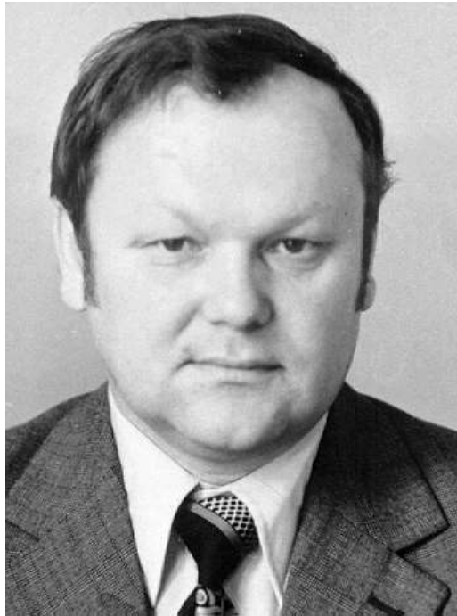
БОРИС ОЛІЙНИК (1935-2017) «Відступник, або Два роки в Кремлі» (1993)

Президент ССРСР «Перестройка и новое мышление для нашей страны и для всего мира» Ідеї економічних, політичних ре- форм, відмова від протистояння з Заходом