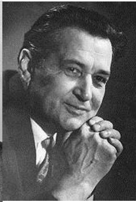
ОЛЕСЬ ГОНЧАР (1918-1995) «Чим живемо: на шляхах до українського відродження» (1991)

Поєднання комуністичної та проукраїнської позиції