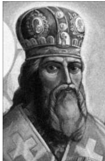
Іов Борецький (невідом. -1631)