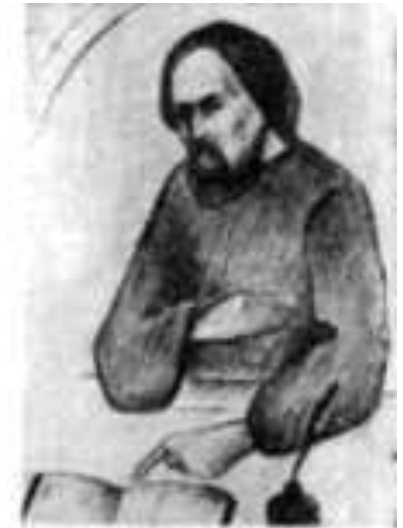
Лаврентій Зизаній (невідом. – 1634-40)