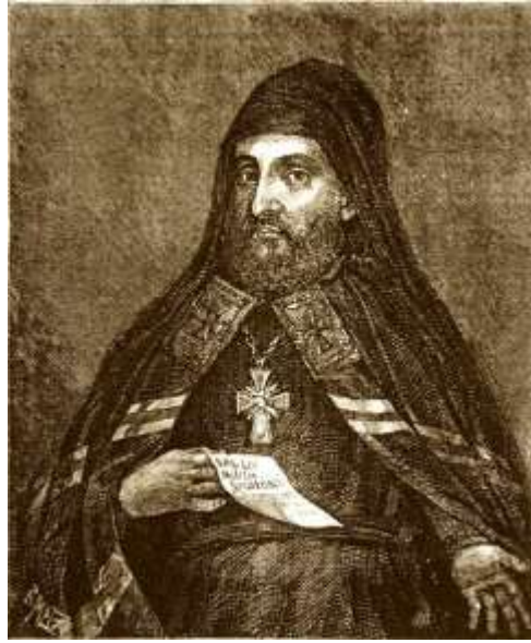
Мелетій Смотрицький (1577-1633)