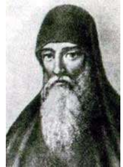
Захарія Копистенський (невідом. - 1627)