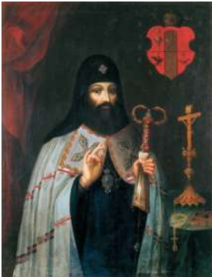
Петро Могила (1596-1647)