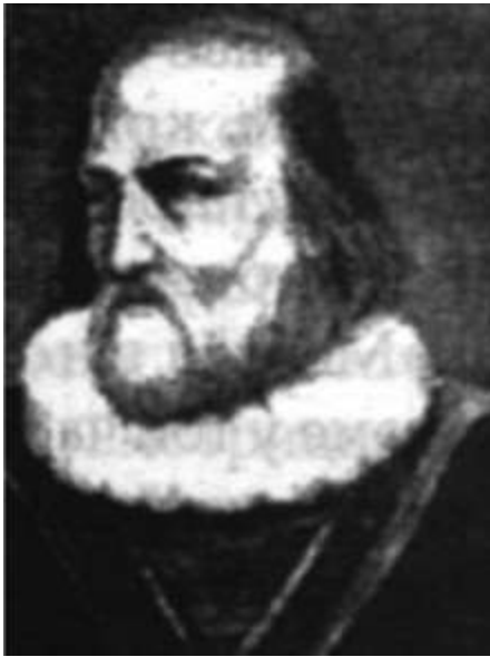
Герасим Смотрицький (невідом. - 1594)