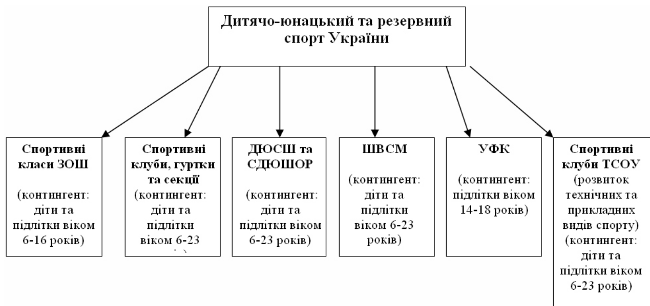
Рис. Організаційна структура дитячо-юнацького та резервного спорту в Україні

У наукових роботах Т. Бондаря (2009, 2010) детально вивчено систему шкільних фізкультурно-спортивних (оздоровчих) клубів. Автором доведено, що фізкультурно-спортивний клуб, як організація, що побудована за принципом учнівського самоврядування, є надзвичайно ефективною формою роботи із школярами щодо виховання у них дієвого відношення до власного здоров'я та формування фізичної культури особистості, їм також науково обґрунтовано та розроблено організаційно-педагогічну технологію